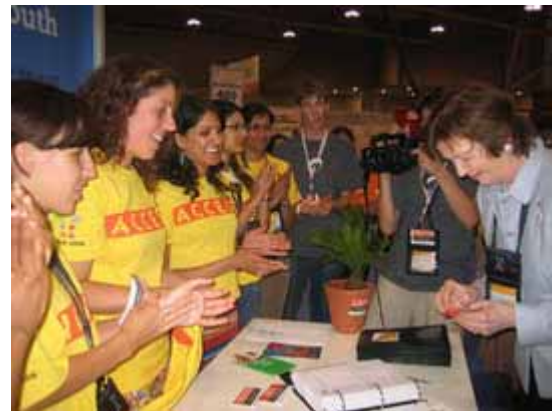
Mary Robinson, directeur de Realizing Rights, prendre l'engagement à le Bureau d'Engagement d'Adulte-Jeunesse ce dernier Août.