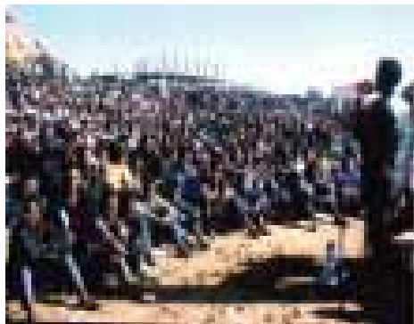
Membres des NUEYS dans un rallye

Les médias ont également joué un rôle avec la diffusion de 90 émissions radiophoniques entre 2002 et 2005, une couverture médiatique de grande envergure avec des poèmes, chansons et jeu de rôles diffusés sur la télévision nationale, un film sur le VIH/SIDA et des articles/publicités dans la revue « Youth » de NUEYS. D'autres approches comprenaient trios descentes sur terrain dans les zones régionales avec quatre unités audio-visuelles mobiles qui ont été utilisés pour conscientiser les populations. Ces unités ont conduit une moyenne de 180 campagnes de proximité depuis janvier 2002 et ont ciblés plus de 1.2 millions de personnes dans tout le pays.