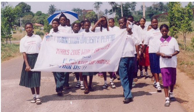
Los estudiantes de Igbinedion Universidad en Nigeria.