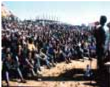
Miembros de NUEYS en una manifestación.

Un foco de atención hacia los medios de comunicación consistió en más de 90 programas de radio transmitidos durante el 2002-2005, una campaña masiva de los medios consistiendo en poemas, canciones y dramatizaciones emitidas en la televisión nacional, una película sobre VIH/SIDA y artículos y anuncios en la revista de NUEYS, "Youth" (Juventud). Otras propuestas incluyeron tres visitas de observación a áreas regionales, resultando en el uso de cuatro unidades móviles audio-visuales para difundir conciencia. Estas unidades móviles audio-visuales realizaron un promedio de 180 visitas de alcance desde enero 2002 y se han dirigido a más de 1.2 millones de gente por todo el país.