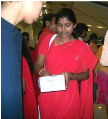
Miembros de Yahaan reparten información.

“La juventud pueda hacer una diferencia en combatir el VIH!” era el mensaje de jóvenes de Pune, India, en el Día Internacional Juvenil. Con un nuevo contagio ocurriendo en la India cada 7 segundos, y con la juventud de la India representando cerca del 10% de la población mundial entera, es vital que nosotros, la juventud de la India, tomemos un papel principal en la lucha contra la propagación del VIH y SIDA. YAHAAN, Youth Action – HIV And AIDS Network (Acción Juvenil- Red de VIH y SIDA), en colaboración con organizaciones juveniles como AISEEC Pune y Rotaract , llevaron a cabo actividades de conscientización acerca del SIDA que eran divertidas, interactivas y incitaban a la reflexión. Voluntarios, equipados